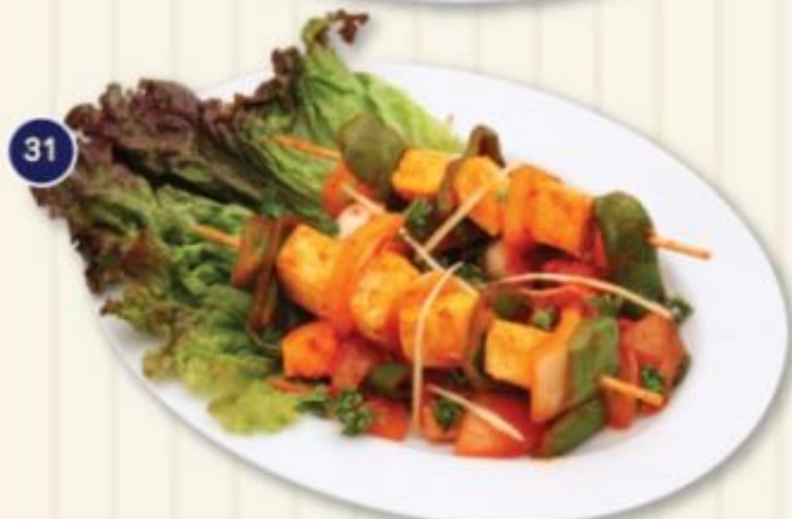
31. パニールサスリク PANEER SASLIK 690円 自家製チーズと野菜の炒め物