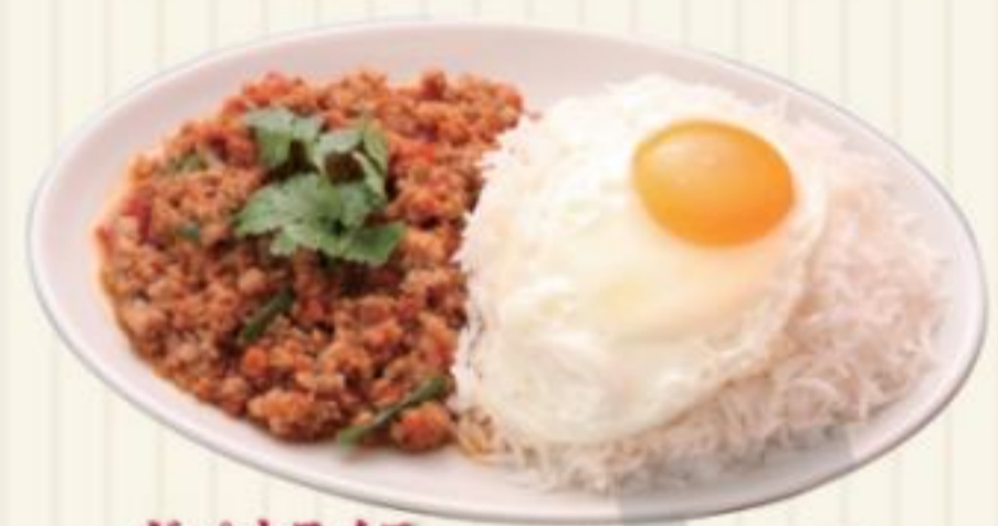
ガパオライス GAPAO RICE 1,100円 鶏ひき肉とバジルのスパイスご飯