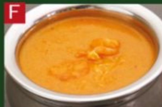
F シーフードカレー SEAFOOD CURRY