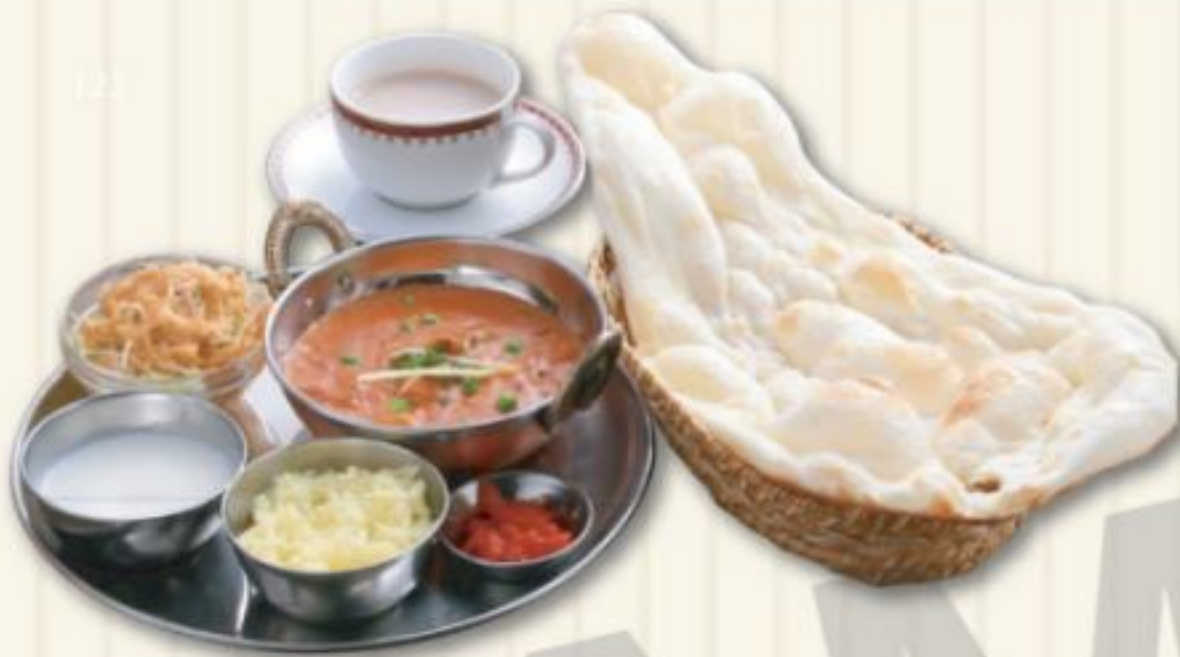
A セット A SET 1,380円

Mild 1 Normal 2 Medium 3 Hot 4 Extra Hot 8 Super Hot ○甘口 ○普通 ○中辛 ○辛 ○大辛 ~ ○激辛