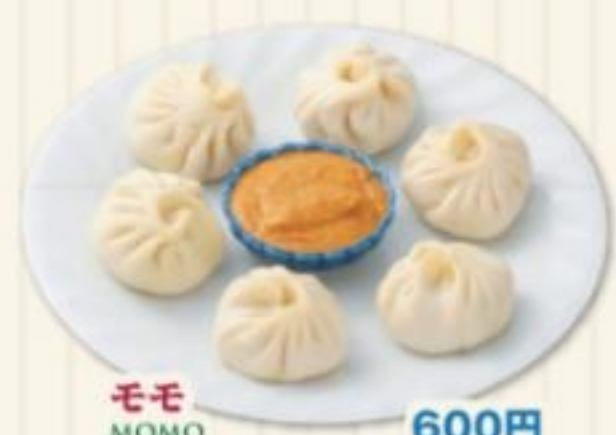
モモ MOMO 600円 ネパール風蒸し餃子