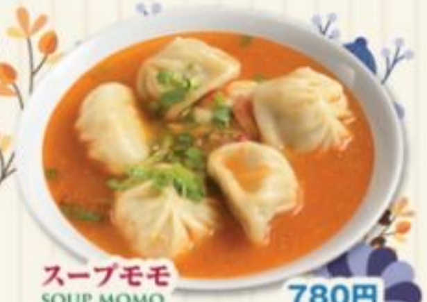
スープモモ SOUP MOMO 780円 ネパール風水餃子