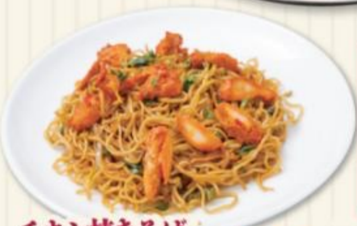
チキン焼きそば CHICKEN YAKISOBA 680円 窯焼きチキン入り焼きそば

スープカレーセット SOUP CURRY SET スープカレー、サラダ ガーリックナン、ライス 漬物、ソフトドリンク Soup Curry, Salad Garlic Nan, Rice Pickle, Softdrink