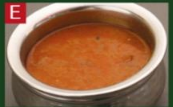
E マトンカレー MUTTON CURRY