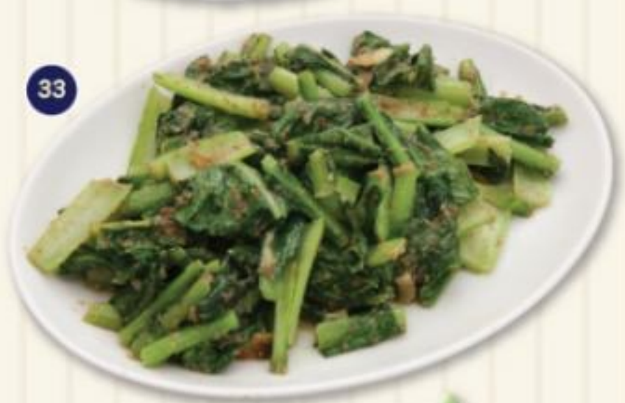
33. プラウンサスリク PRAWN SASLIK 690円 野菜とエビの炒め物