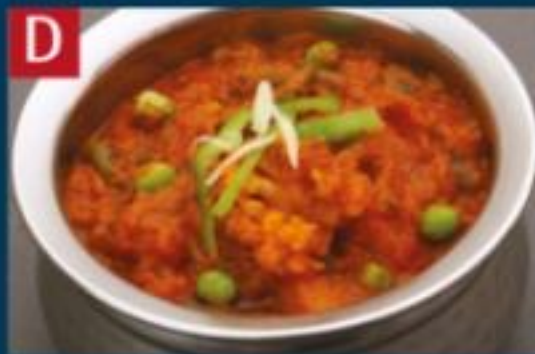
D ミックス野菜カレー MIX VEGETABLE CURRY