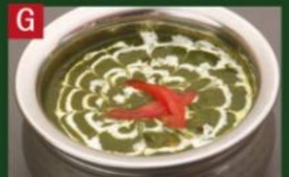
G ダル【豆】ほうれん草 DAL PALAK CURRY

【追加注ぎ】各+250円 マンゴーラッシー、プレーンラッシー、 アイスコーヒー、ウーロン茶、 マサラティー