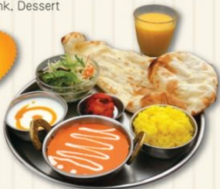
お子様セット A CHILD SET A 890円

バターチキンカレー、サラダ、ナン、ライス、デザート、 チキンティッカ、マンゴーラッシー Butter Chicken Curry, Salad, Nan, Rice, Dessert, Chicken Tikka, Mango Lassi