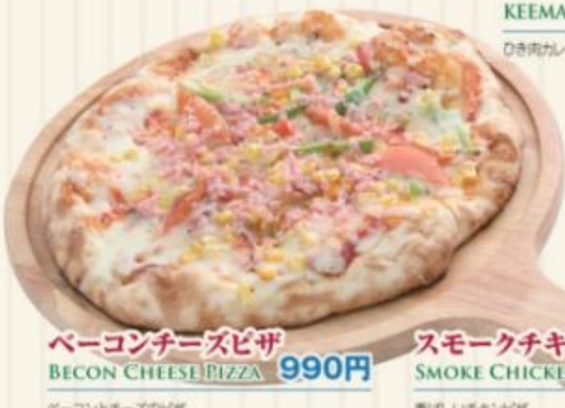
ベーコンチーズピザ BECON CHEESE PIZZA 990円 ベーコンとチーズのピザ