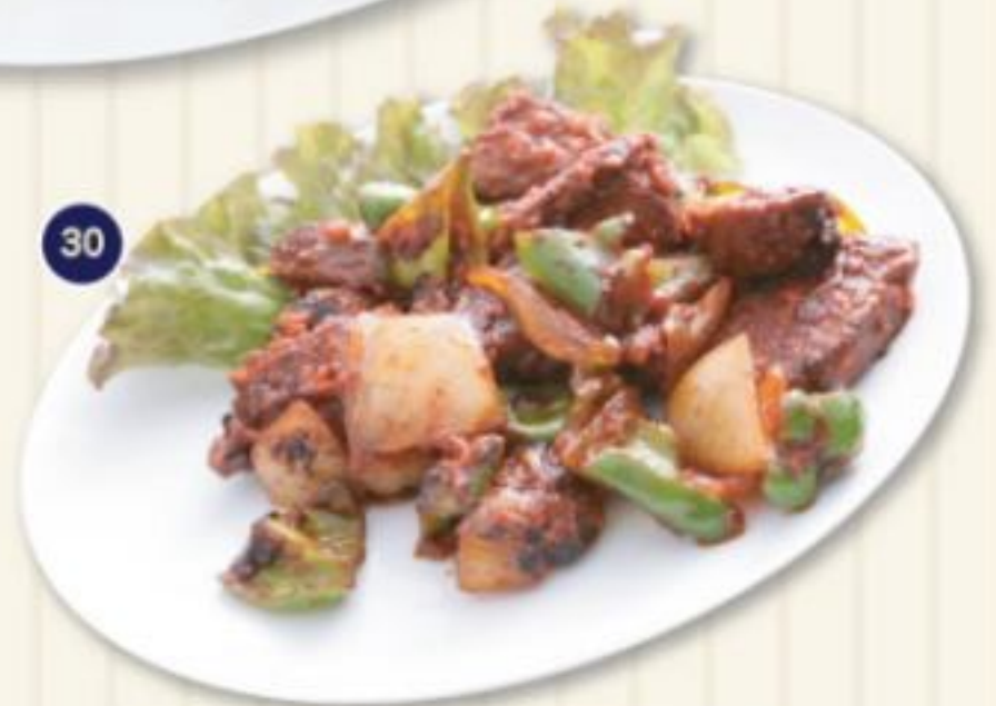
30. マトンチリ MUTTON CHILLY 780円 少しピリ辛な羊肉のチリ炒め