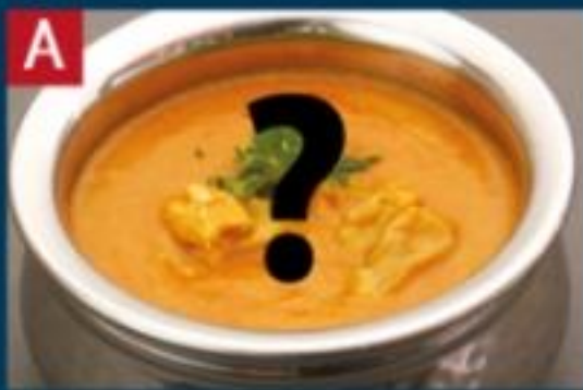
A 日替わりカレー DAILY SPECIAL CURRY