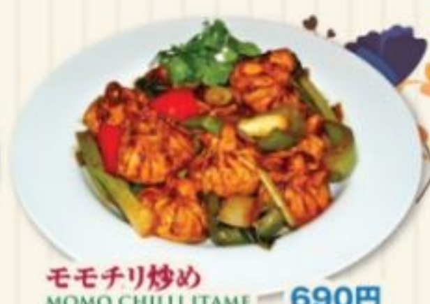
モモチリ炒め MOMO CHILLI ITAME 690円 ネパール餃子のヒリ辛チリ炒め