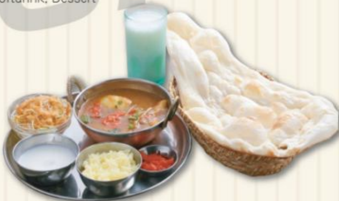
C セット C SET 1,480円

チキンマサラカレー、サラダ ガーリックナン、ライス、漬物、ソフトドリンク、デザート Chicken Masala Curry, Salad, Garlic Nan, Rice Pickle, Softdrink, Dessert