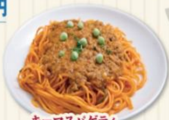
キーマスパゲティ KEEMA SPAGHETTI 780円 ひき肉カレーたっぷりのパスタ