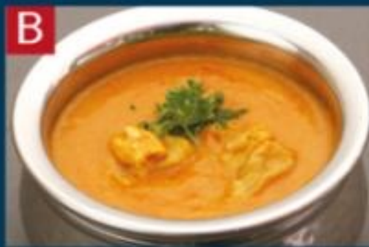
B チキンカレー CHICKEN CURRY