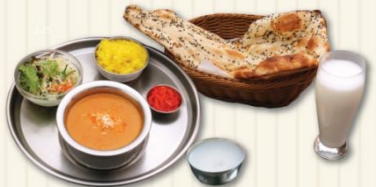
D セット D SET 1,580円

マトンドピアザ、サラダ ナン、ライス、漬物、ソフトドリンク、デザート Mutton Do Piyaza, Salad, Nan, Rice, Pickle, Softdrink, Dessert