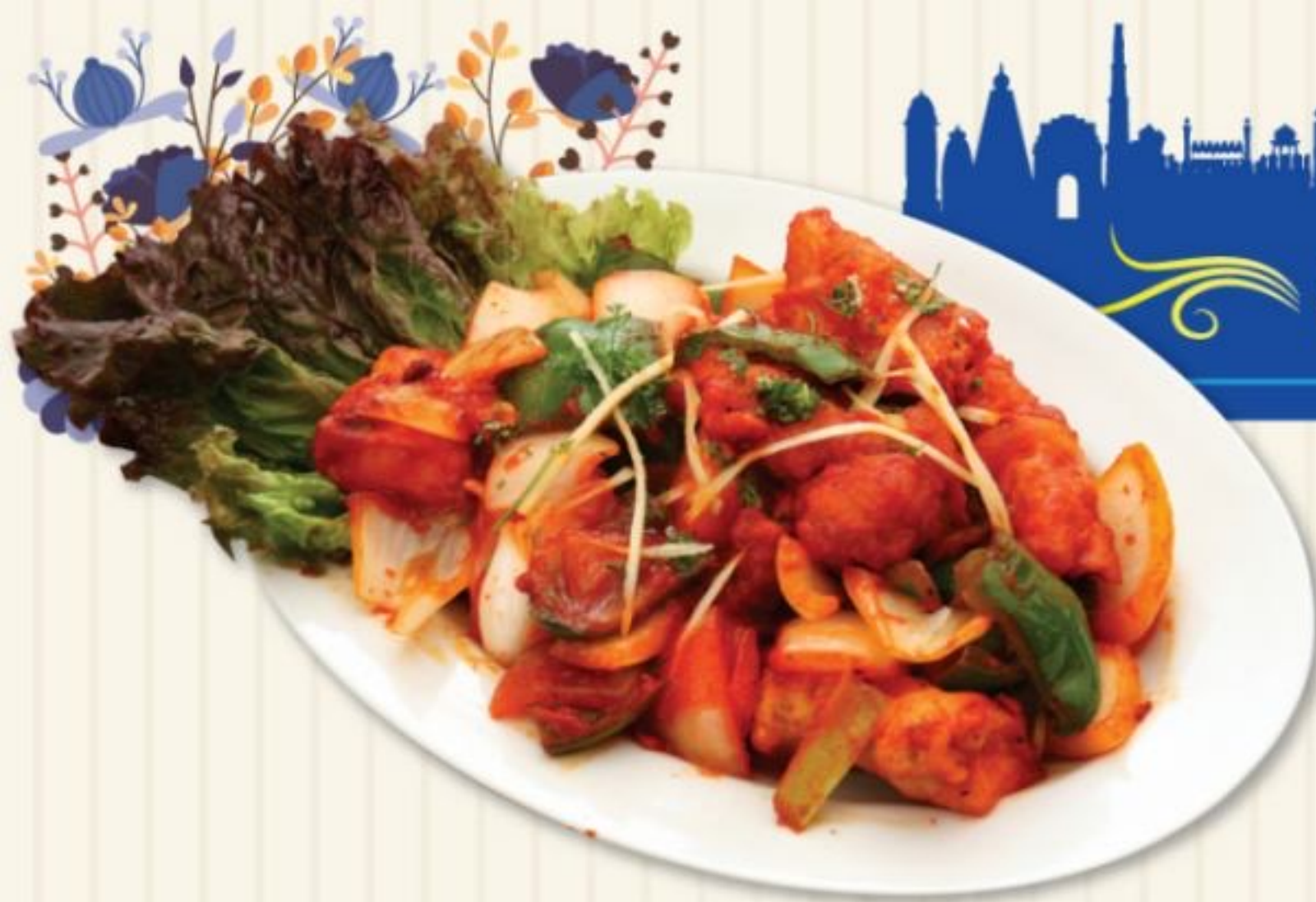
27 チキンチリ CHICKEN CHILLY