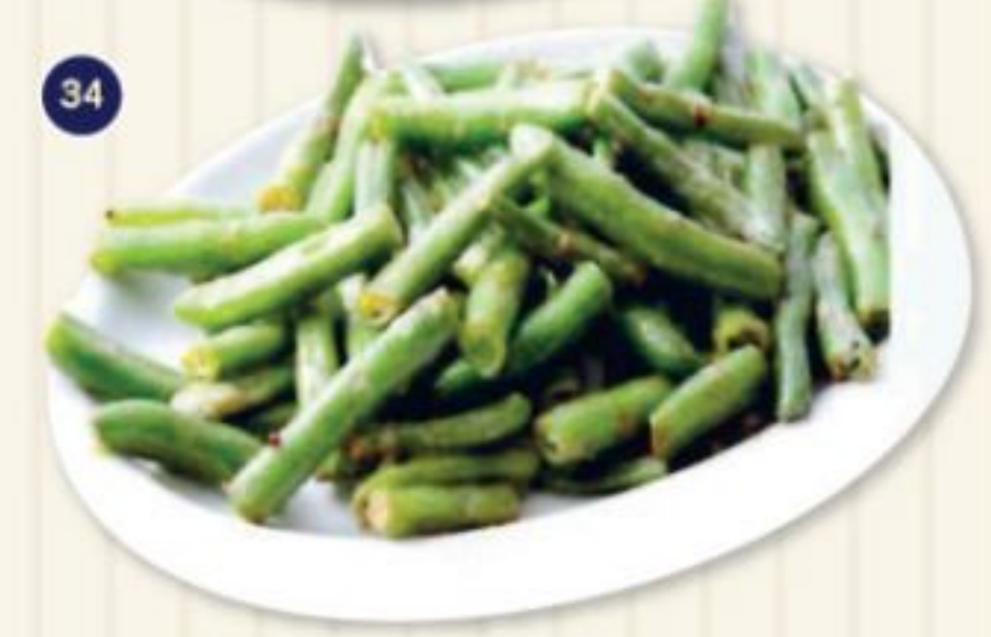
34. いんげん炒め INGEN ITAME 580円 いんげん豆とマヨネーズ、ブラックペッパー、塩で味付け