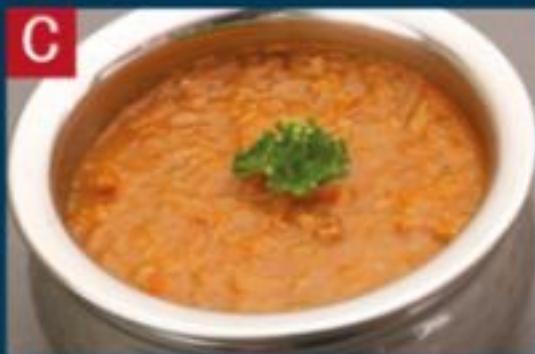
C キーマカレー KEEMA CURRY