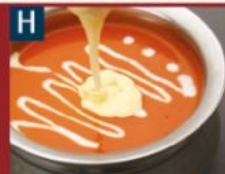
H バターチキンカレー BUTTER CHICKEN CURRY 900円

追加ナン】各+250円 チーズナン、ゴマナン、 ガーリックナン、明太子ナン、 バジルチーズナンなど