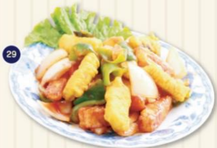
29. フィッシュチリ FISH CHILLY 620円 少しピリ辛な魚のチリ炒め