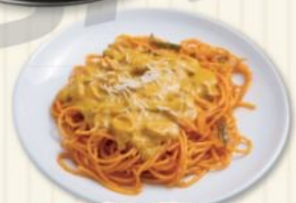
シーフードスパゲティ SEAFOOD SPAGHETTI 800円 魚介カレー乗せパスタ