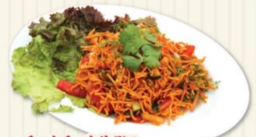
チャウチャウサデコ CHOW CHOW SADEKO 500円 揚げ麺と野菜のスパイス和え