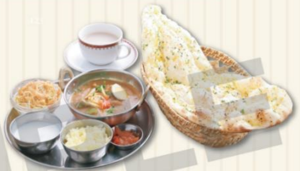
B セット B SET 1,480円

野菜マッカンワラカレー、サラダ ナン、ライス、漬物、ソフトドリンク、デザート Vegetable Makhana Wala, Salad, Nan, Rice, Pickle, Softdrink, Dessert