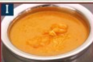
I シーフードカレー SEAFOOD CURRY 850 円