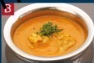
B チキンカレー CHICKEN CURRY