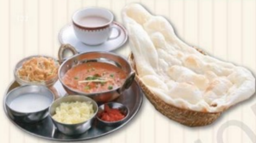
A セット A SET 1,300円

Mild 1 Normal 2 Medium 3 Hot 4 Extra Hot 8 Super Hot ○甘口 ⊖普通 ⊖中辛 ⊖辛 ⊖大辛 ~ ⊖激辛