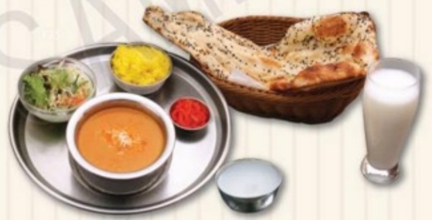
D セット D SET 1,500円

マトンドピアザ、サラダ ナン、ライス、漬物、ソフトドリンク、デザート Mutton Do Piyaza, Salad, Nan, Rice, Pickle, Softdrink, Dessert