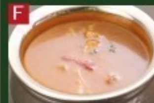
F ポークカレー PORK CURRY