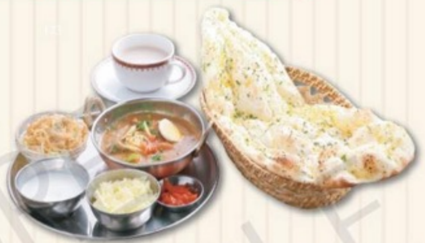
B セット B SET 1,400円

野菜マッカンワラカレー、サラダ ナン、ライス、漬物、ソフトドリンク、デザート Vegetable Makhana Wala, Salad, Nan, Rice, Pickle, Softdrink, Dessert