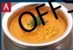
A 日替わりカレー DAILY SPECIAL CURRY