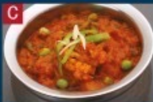
C ミックス野菜カレー MIX VEGETABLE CURRY