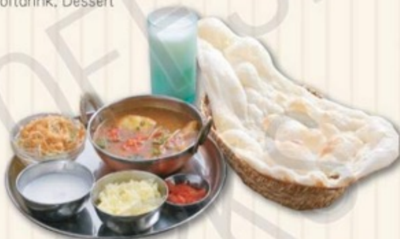
C セット C SET 1,400円

チキンマサラカレー、サラダ ガーリックナン、ライス、漬物、ソフトドリンク、デザート Chicken Masala Curry, Salad, Garlic Nan, Rice Pickle, Softdrink, Dessert