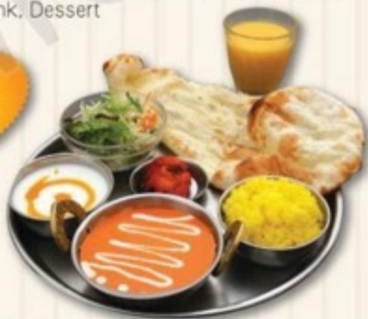
お子様セット A CHILD SET A 890円

バターチキンカレー、サラダ、ナン、ライス、デザート、 チキンティッカ、マンゴーラッシー Butter Chicken Curry, Salad, Nan, Rice, Dessert, Chicken Tikka, Mango Lassi