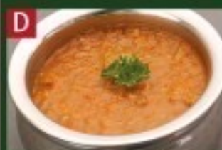
D キーマカレー KEEMA CURRY