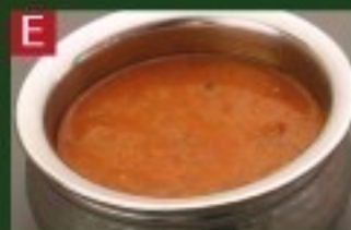
E マトンカレー MUTTON CURRY