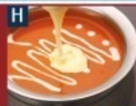
H バターチキンカレー BUTTER CHICKEN CURRY 900 円