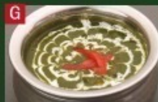
G ダル【豆】ほうれん草 DAL PALAK CURRY